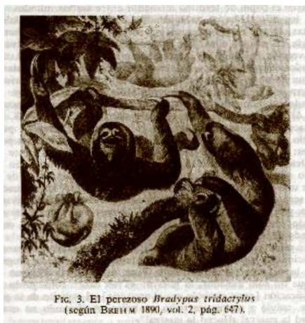
FIG. 3. El perezoso Bradypus tridactylus (según BAEH W 1890, vol. 2, pág. 647).

buscar arcilla junto a la orilla durante la noche fue sepultada con su hijo por otra razón: la dueña de la arcilla no podía soportar que se turbara su sueño. Desde entonces, un hechicero-curandero acompaña siempre a la gente que quiere proveerse de arcilla, y se tiran hojas de coca en la excavación para apaciguar a la dueña del barro de alfarería. Ésta ejerce también su vigilancia más allá de su dominio territorial: se cuenta que una mujer había abandonado su casa olvidando llenar de agua sus vasijas; la dueña de la arcilla y de las vasijas de barro castigó a la negligente confiscándole su vajilla.