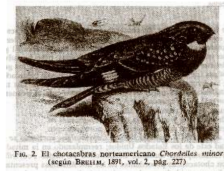
FIG. 2. El chotacabras norteamericano Chordeiles minor (según BRELLM, 1891, vol. 2, pág. 227)

Hay un mito que describe el origen de estos ritos. Hubo hace tiempo un hermoso joven que despreciaba a las mujeres. Cierta día, al despertar, sorprendió a una que abandonaba su lecho. Apareció cuatro veces y el héroe decidió seguirla. Ella se dirigió hacia el Norte. Al caer la noche, un chorlito real Kildir voló ante ella. La mujer lo reconoció como un explorador de los Grandes Pájaros, y pidió a su compañero que cortara una rama de cerezo silvestre