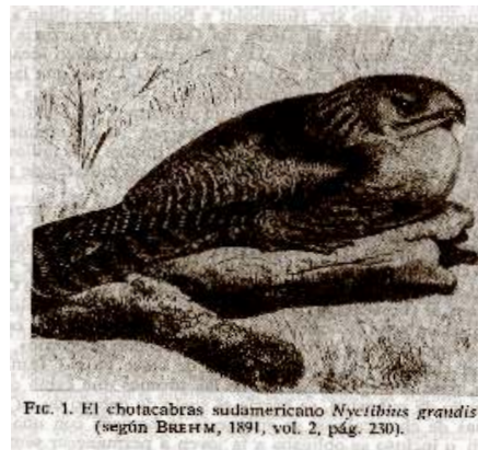
FIG. 1. El chotacabras sudamericano Nyctibius grandis (según BREHM, 1891, vol. 2, pág. 230).

Los yurucarés, que habitaban también al pie de los Andes pero mucho más al sur, rodeaban el arte de la alfarería de precauciones exigentes. Las mujeres, las únicas que lo practicaban, iban solemnemente a buscar la arcilla durante el período del año que no estaba reservado a las cosechas. Por temor al trueno y para escapar a las miradas, se ocultaban en un