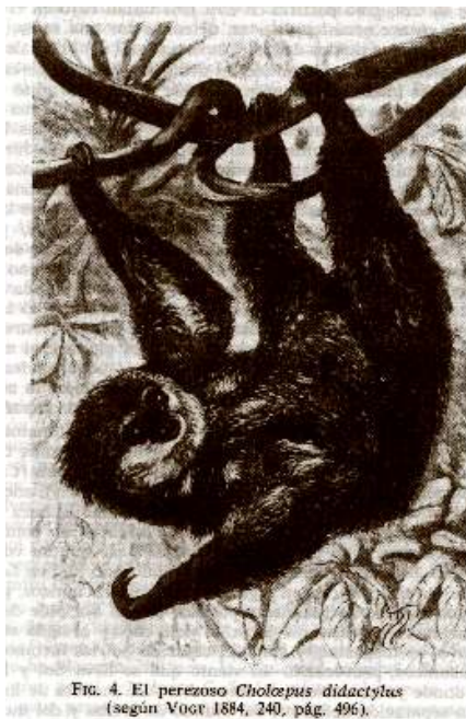
FIG. 4. El perezoso Choloepus didactylus (según Voer 1884, 240, pág. 496).

Por otro lado, los jíbaros poseen asimismo mitos relativos a dos huérfanos, o a una joven mujer despreciada por los suyos porque no sabía de alfarería. Nunkui,