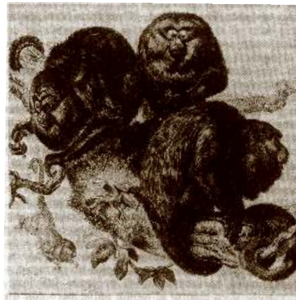
FIG. 6. El mono sullador negro Alouatta (antiguamente Mycetes ) niger (según BRAHM, 1890, vol. I, pág. 205).

Contrariamente a la anterior, no llega a desembarazarse del bastón que ha atado imprudentemente alrededor de su talle para que le hiciera de marido. El hombre, representado aquí por un bastón, se aferra de este modo a ella en lugar de hacerlo ella a él. Hombre paralizado o bastón, en ambos casos los mitos reducen el