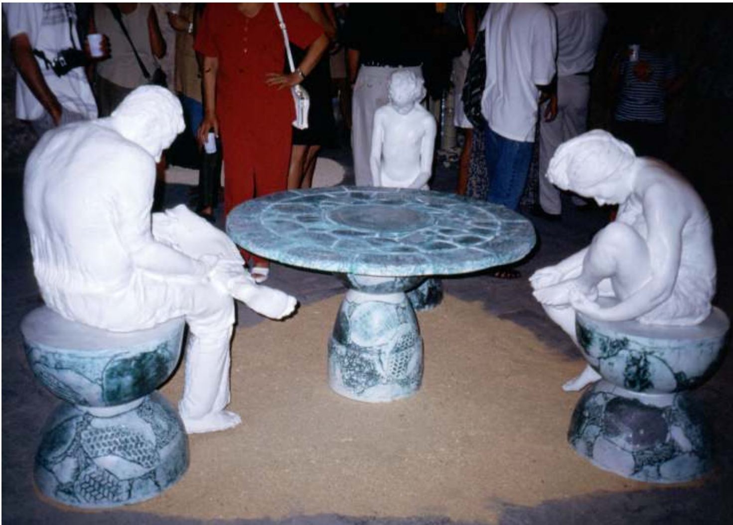
Carlos Alberto Rodríguez, La mesa del silencio , 2000