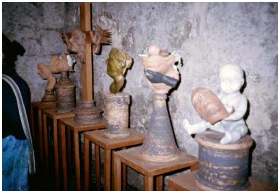
Edel Arencibia, Cada vez me parezco más a mi autorretrato