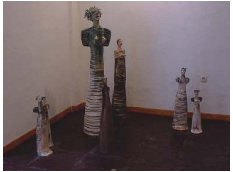
Nevenka Pavic, Sin Título , cerámica esmaltada

bella. Unos segundos de admiración ofrecen una realidad fingida. La naturaleza inalterable de los elementos es ficticia. Siempre en lucha permanente, el tiempo batallador se erige en poder indiscutible y maestro de formas”.