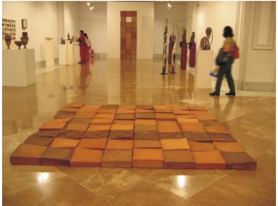
A. Ruiz de Almodóvar, Suelo , arcilla refractaria