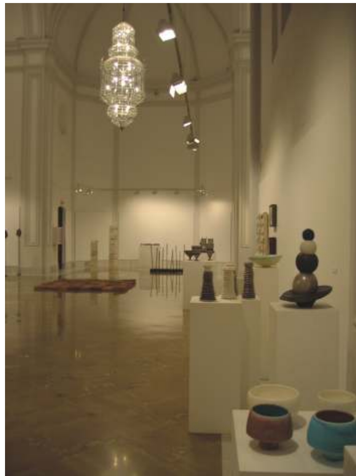
Vista general de la sala, a la derecha obras de Carmen de Vila

Ante la diversidad de propuestas es posible que el espectador se sorprenda y necesite acercarse para ver, sentir y disfrutar de la enorme riqueza de proposiciones, formas, texturas, colorido, claroscuro, oquedades, signos, elementos que otros materiales escultóricos difícilmente reúnen. Experiencias arquitectónicas, totémicas, instalaciones, sentido de monumentalidad, figuración,