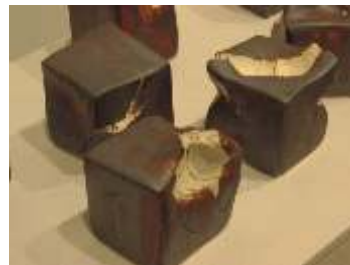
A. Martínez: Dígitos I , Porcelana Columna I y II , 2003, Porcelana, medidas variables

desde siempre marcaron el estatus de la persona o grupo que los poseía, han sido tan necesarios y consustanciales que en nuestra civilización alcanzaban, como máximo, la categoría de arte menor, suntuario, artesanía o alfarería. En el siglo pasado la sociedad se vio inmersa en un proceso de transformaciones sin retorno, en el que estos utensilios perdieron su cualidad fundamental: la necesidad de emplearlos en la vida doméstica. Las fuentes, jarras, soperas, etc., eran sustituidas por otras fabricadas industrialmente, todas exactamente iguales y fáciles de reponer, aunque carentes de alma. Muchas alfarerías y tipologías cerámicas tradicionales desaparecieron para siempre y otras, ante la necesidad de subsistir, se vieron obligadas a traicionar sus cimientos más profundos.