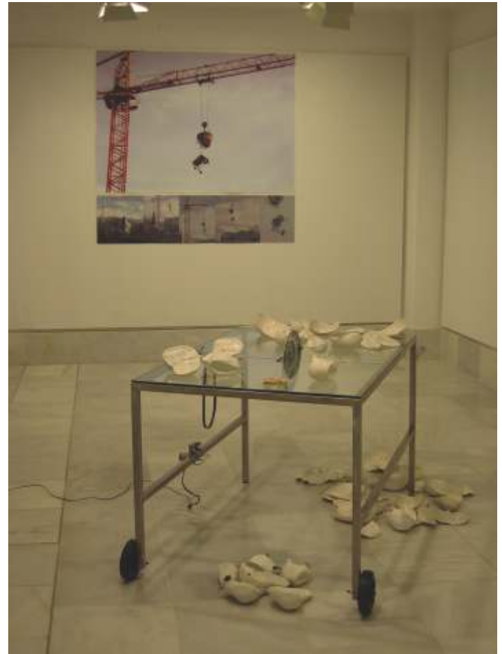
Carmen Osuna, Sobremesa , 2003 porcelana, acero inoxidable, cristal y fotografías.

Esta exposición se realizó en Granada en el Centro Cultural Gran Capitán del 3 al 30 de abril del 2003. Agradecemos a los participantes su colaboración en nuestra revista.