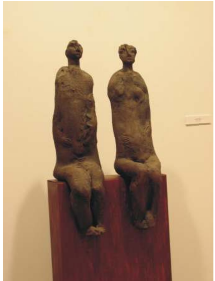
Al Bacha, Espera , refractario

Las raíces de este foco de creadores, que desarrollan su labor en Granada, son muy profundas; algunos ellos mostraron conjuntamente su obra en las