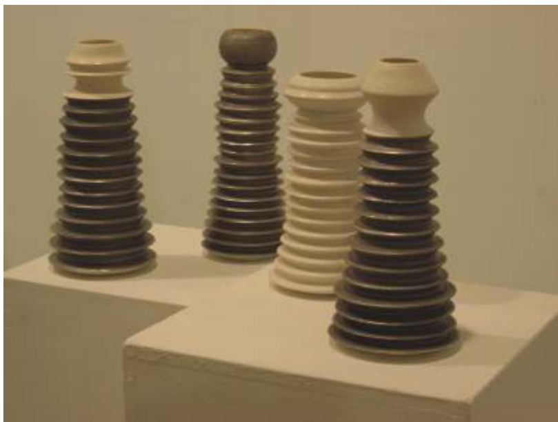
Carmen Vila, Tornillos , 2000, porcelana

volúmenes tridimensionales realizados a torno; u otras, cuyo fin último es la búsqueda de la armonía y la belleza. Esta conjunción de variantes, incluso le incitarán a ayudarse del tacto para completar y ordenar sus emociones.