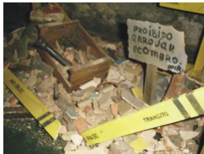
P Urbano 12

La culpa fundamental de éstos y muchos otros inexplicables desatinos que acontece en todo el proceso de la creación artística, una larga cadena entre el creador y el espectador, no la tienen ni los críticos, ni los curadores, tampoco la tienen los galeristas y coleccionistas ni los medios de difusión masiva y mucho menos los artistas. Todos somos víctimas, pero lamentablemente también, todos somos cómplices. Ciertamente hay distintos grados de complicidad. Algunos son más cómplices que otros. Unos son indiferentemente cómplices, otros inocentemente o ignorantemente cómplices, otros tácitamente cómplices, pero todos, cómplices al fin. La culpa, ya se sabe, la tienen esas sociedades «libres» y «democráticas» con economías de mercado y otras supuestas bondades y etcéteras exhibidas en sus vitrinas de consumo, ahora en proceso de renovarse con teorías y prácticas económicas neoliberales donde todo va a seguir teniendo su precio. Precio que por supuesto siempre fijan los ricos, hijos legítimos del sistema y herederos directos del mismo. Verdaderos culpables del enmierdamiento de la humanidad. Son esa gente impúdica y deshonestamente rica, quienes, como cierto grupo de infames banqueros japoneses, paga de forma