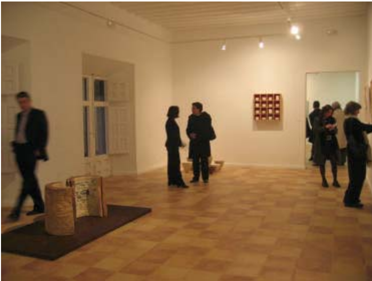
Vista general de la exposición Madola , a la izquierda, Brocal , 1998, refractario, 80x50x53