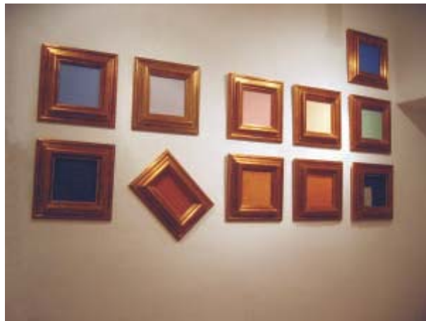
Montserrat Altet Paisajes de paisajes , arcilla cuarteada, BCN y asfalto, 33x5x48'5

tegui la cual contenía sonido. Se trataba de una especie de misil-tinaja que desprendía un terrible zumbido de aeropuerto mientras unos aviones pequeñitos parecían sobrevolarla, aunque permanecían estáticos, a no ser por uno que aparecía roto en el suelo, que el propio artista hizo caer el día de la inauguración, permaneciendo allí los fragmentos del "desastre".