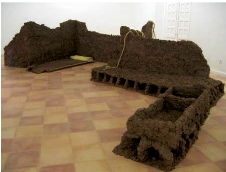
Evaristo Navarro Vivac , 2004, gres crudo

La obra de Carmen Osuna, Sobremesa , también juega con cierta idea irónica utilizando la metáfora y la condensación para crear relaciones de unos objetos con otros similares. La obra consta de una fotografía de una grúa que porta una mesa de disco de corte. Dicha mesa se encuentra situada delante de la foto, aunque está realizada con cristal y acero inoxidable, el disco de corte es sustituido por un plato típico de