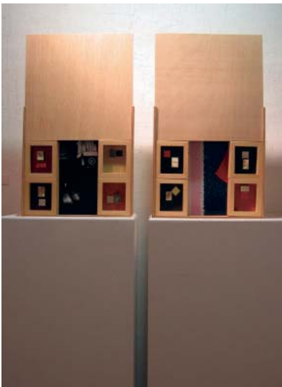
Mariano Calvé , Oriente-Occidente , 2004, raku, madera y fotos, 78x47 cm 2 piezas

los escultores como los ceramistas, que es el cuenco de las manos, con el que concebimos nuestra sobras (...) Esta exposición nada tiene que ver con ese aspecto tradicional y conocido de la cerámica a la que estamos acostumbrados. Es ésta una propuesta novedosa y moderna, a base de materiales con los que los artistas experimentan y hacen sus creaciones; artistas del máximo nivel no sólo dentro de nues-