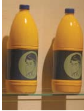
Oscar Mora, Los nuevos monos sabios, 2003 mayólica y hierro, 100x100 El supermercado de las emociones, olé, 2003 mayólica, 15'5x9x6, 80 piezas