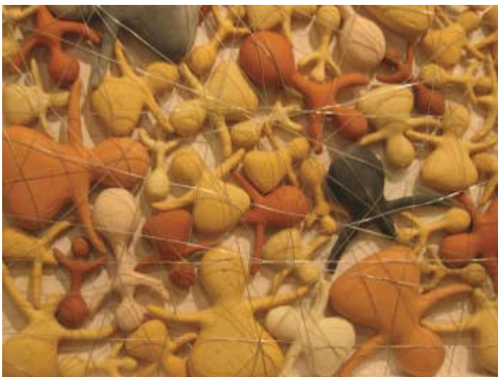
Ana Pastor Dones lligades , 2002, gres y cordel sobre madera

espacio físico en el que se ubica la muestra. Un lugar como es Cuenca, metida entre dos hoces, en una especie de cuenco, aspecto que nos sirve para poner en claro el concepto con el que trabajamos, tanto