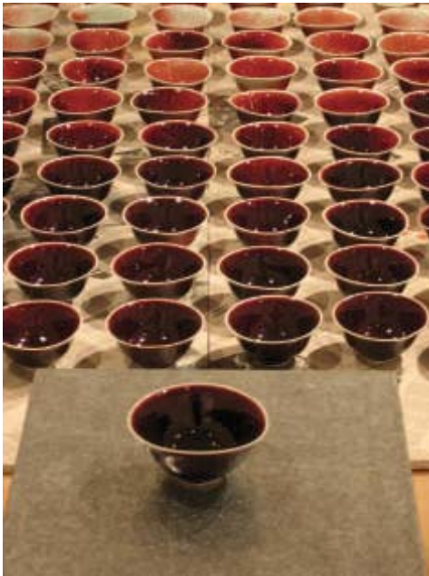
Fernando Alcalde 101 cuencos de Cuenca en Cuenca, 2004, porcelana zinc y papel, 200x230 cm

vajilla de la cartuja que gira cuando te acercas, y en vez de ladrillos cortados, encontramos fragmentos del aparato digestivo, como estómagos o hígados, sobre la mesa y esparcidos por el suelo.