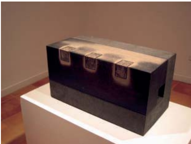
Eric Mestre S/T 2000, gres chamoteado y engobe, 32x60x31

A pesar de la heterogeneidad que conlleva esta apuesta, el resultado ha sido un éxito, al que ha ayudado la elección del lugar expositivo. pues la organización en un espacio tan amplio ha permitido que las obras puedan respirar sin interferencias. Herminia comentó al respecto: "Cuenco hace, en primer lugar, con la palabra, un homenaje al