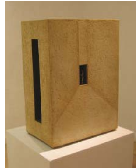
Su-Pi Shu Sueños , 2003, gres chamoteado y engobes 23'5x39x50