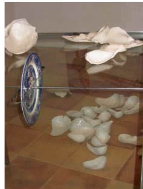
Carmen Osuna Sobremesa , (detalle) 2002, porcelana, cristal, acero inoxidable y foto

sabios y El supermercado de las emociones (olé) . Óscar, con una fuerte ironía, reproducía los stand de los supermercados y elevaba a objeto supremo, a fetiche