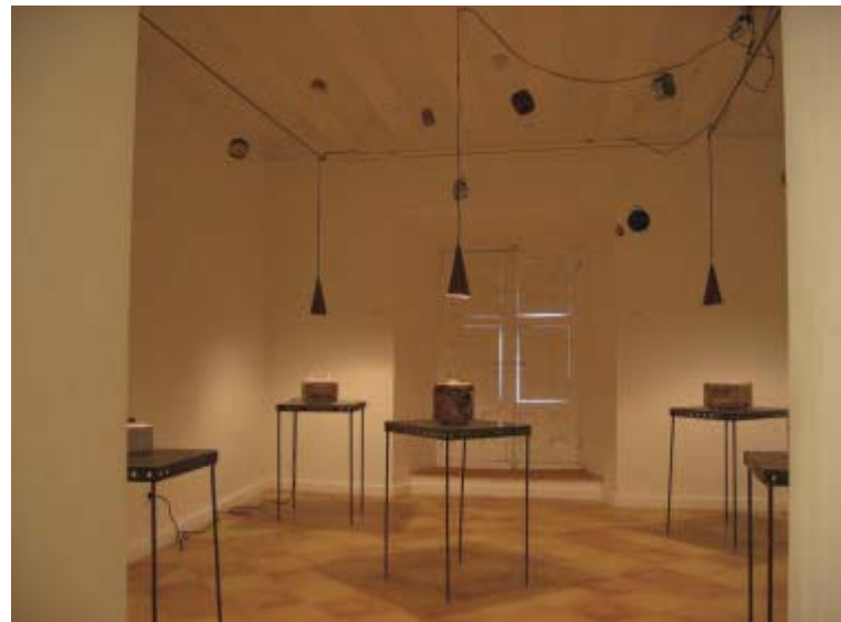
Xavier Monsalvatje Contenedores de plagas, 1995, cerámica, cristal, cobre, hierro y vidrio,