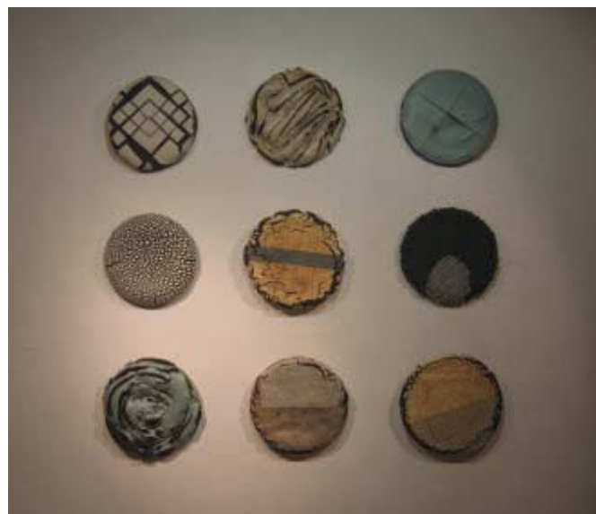
Rafael Pérez S/T , 2002, diversas pastas, tierra sigilata y esmalte, 150x150

espacio físico en el que se ubica la muestra. Un lugar como es Cuenca, metida entre dos hoces, en una especie de cuenco, aspecto que nos sirve para poner en claro el concepto con el que trabajamos, tanto