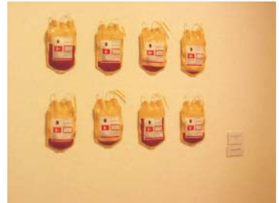
Solange Simas Shout of life (Primer Premio)