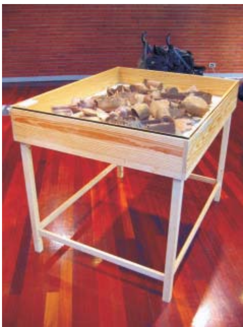
Espacio de naturalezas artificiales

En el catálogo añadía la frase: “El arte puede dañar seriamente la salud”. Los títulos eran: La belleza no reside en sí misma, sino en el arte de hacerlo bello , Rosas sin espinas , belleza sin dolor y La libertad de la jaula de oro .