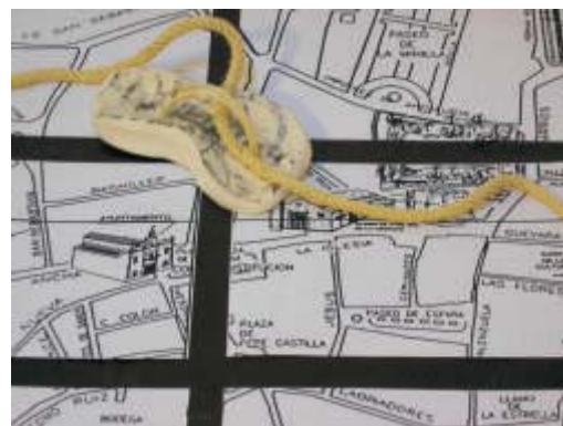
Chato Alonso. Huella civil