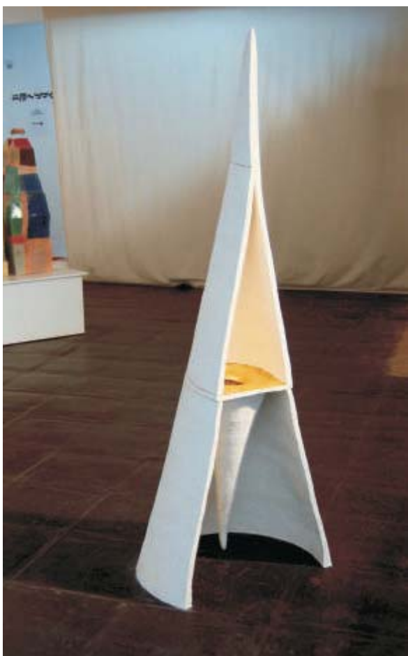
Sara Cardoso Depositario

mais leves e podermos voar!)”. Espaço de depósito, de entrega, de purificação y silencio. (para que seamos más leves y podamos volar!)