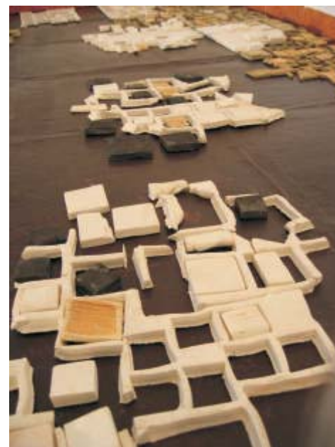
Mónica Maz. Paisajes