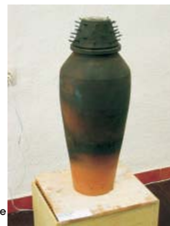
Xavier Montsalvatje La luz del tinajero

fiere un carácter lúdico y participativo, aspecto que también desarrolló, con gran entusiasmo de los participantes, ayudando a refrescar el caluroso verano rambleño.