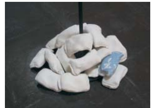
Dolores Tarrazón. La isla de los Sueños y Protección.