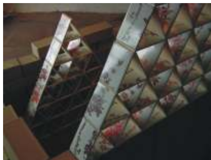
Ofeña, 2005 (Detalles)