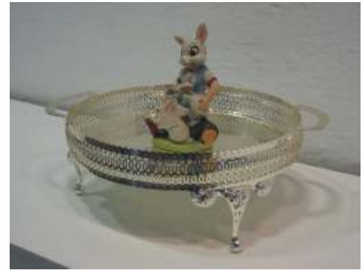
Dame las zanahorias o se las lleva el conejo, 2005, 35x35x23 cm

elección final fue la de a diferencia de plantear una muestra internacional con la presencia de artistas de diferentes países, presentar un diálogo entre tres artistas nacionales y tres británicos, elección sobrevenida por la presencia que el arte británico ha experimen-