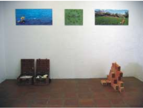
Picnic (en construcción) 2002 Objetos, cerámica y fotografías