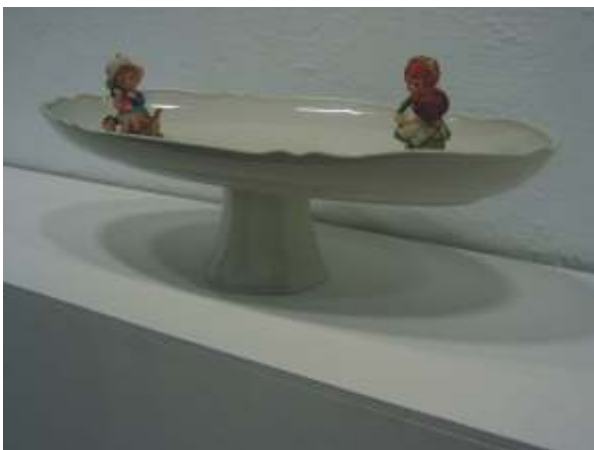
¡Oye! le gustas a mi amiga 2004, 63x31x35 cms

tado en los últimos años después del fenómeno de los Young British Artists (después de la tormenta, llega la calma) y por la existencia de los trabajos de tres artistas que me interesaron por los enfoques desde los que abordaban el proceso cerámico.