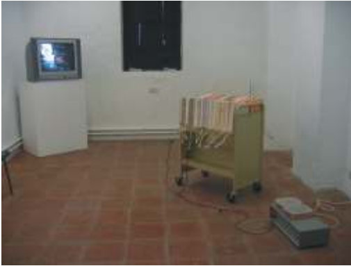
Library, 2004 Cerámica y resistencias