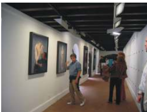
Entrada a La Posada del Potro y vistas de la exposición

Una vez visto el objetivo, y con la mesa puesta para recibir a los invitados, la opción fue la de tirar del mantel, y romper con la línea llevada a cabo por los anteriores comisarios (compañeros y además amigos). De ahí el título de la exposición Platos rotos, donde la idea de la ruptura, del cambio, de la fragmentación y de la sorpresa me llevaron a acordarme de una frase de Dick Hebdige en Subcultura donde