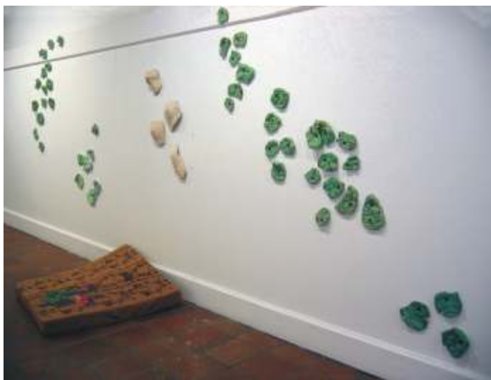
Ofeña, 2005 cerámica y colchoneta con bordados