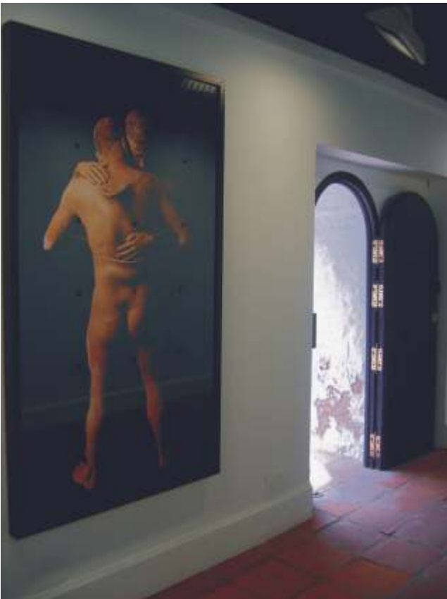
Materia penetrables, 2001

do por la manera en que se deslizaba entre los géneros, escurriéndose casi como lo hacen las manos de la Gemelación incompleta que presentaba en la exposición.