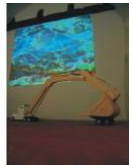
Vídeo (detalle fotogramas)