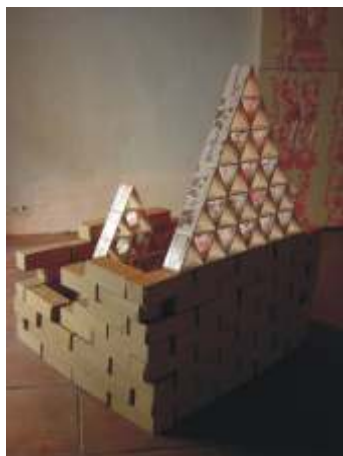
Casa, 2001 (Detalles)