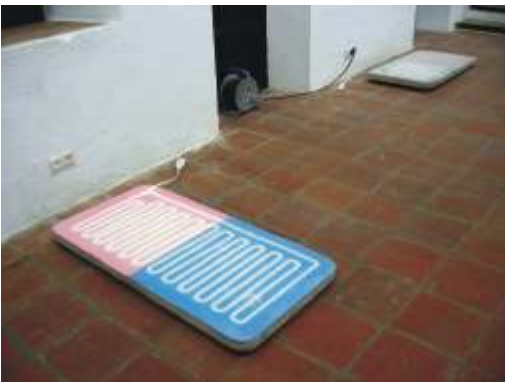
Electric drawing, 2004 cerámica, pigmento termoeléctrico y resistencias eléctricas

El primero de ellos fue Barnaby Barford, un joven artista británico cuyo trabajo se presenta desde el ámbito del diseño, la cerámica y la instalación que me interesaba por la manera irónica con que abordaba cuestiones que tenían que ver con la política, la sociedad, la belleza o la infancia. Con un método de trabajo basado en la apropiación de piezas de cerámicas prefabricadas y su recontextualización o post-producción (en el sentido de Bourriaud) en nuevas situaciones sobre elementos de loza industrial, las piezas de Barney plantean cuestiones como la diferenciación entre alta y baja cultura ya arrastradas desde el pop de los sesenta pero con un nuevo enfoque más cínico donde Barney