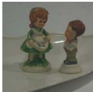
¿Qué hay para cenar esta noche? 2004, 28x28x16 cms