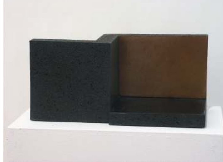
2003 - murales. Doble cocción

para expresar el momento en el que vives cualquiera de la líneas de las que estamos hablando.