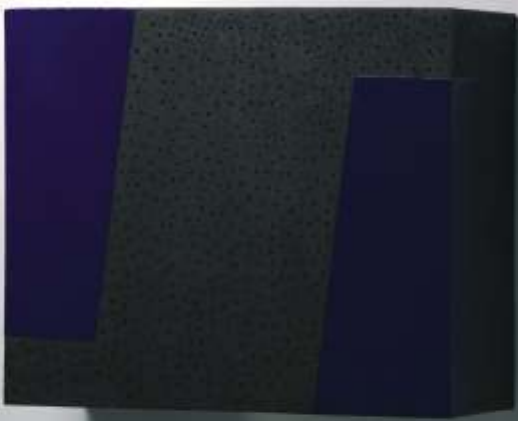
Gres, 24x57x73 - 2005

miento de la técnica, aunque hoy en día las industrias disponen y suministran toda clase de pastas y barnices. Quién sabe lo que quiere, lo persigue y crea su propia técnica. Todos los ceramistas importantes desarrollan una manera de hacer personal que los caracteriza.