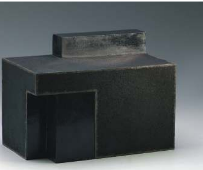
35,3x26x21 - 2004- doble cocción

En pintura no se nota tanto porque hay mucha gente buena, y esta gente sostiene la calidad, pero en cerámica hay muy poca gente profesional que trabaje a un cierto nivel en España. Hay muchos ceramistas que empiezan pero es un drama el esfuerzo y los costes de mantenimiento de un taller cerámico, es muy complicado.