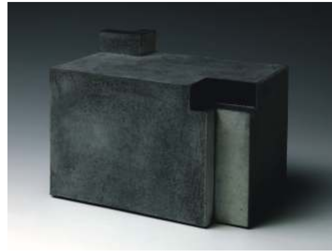
Gres, 28x35x22 - 2004

Pero puede dar ideas en cuanto al color...