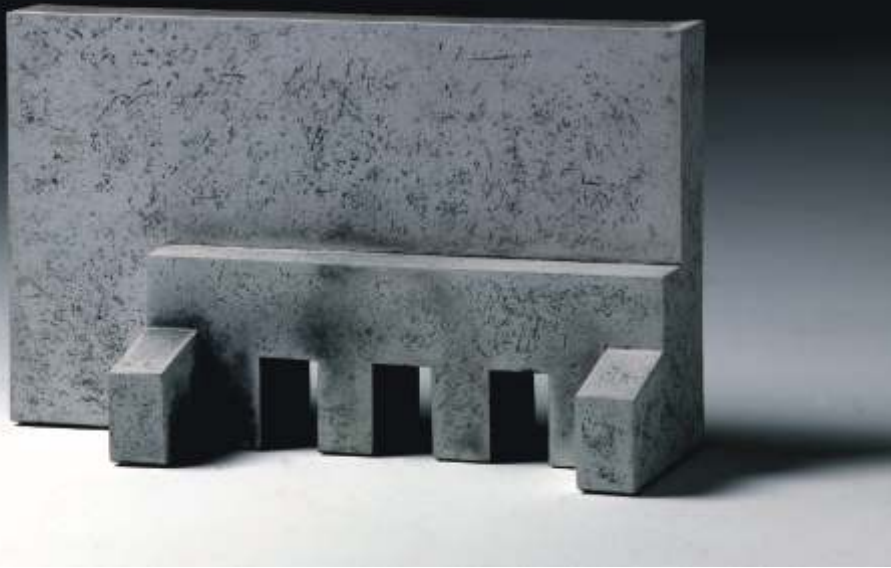
Gres, 33x56x19 - 2003