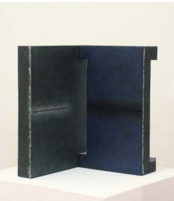
37x33,5x27,5 - 2004 - gres.

Alfonso Ariza, en el pueblo alfarero de La Rambla, en Córdoba, ¿cómo valoras este tipo de iniciativas quizás no tan académicas?