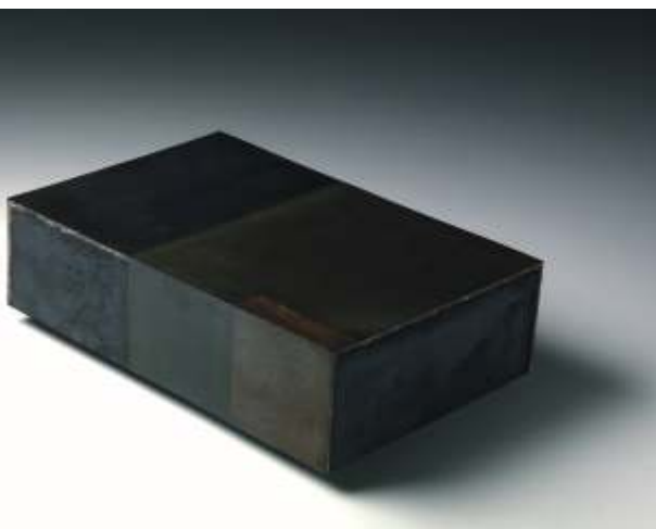
Gres, 70,5x20x46 - 2005

Sí, lo que pasa es que la sociedad actual la puedes enfocar como quieras, como una sociedad caótica o como una sociedad en la que falta un cierto orden, un cierto rigor una cierta coherencia: Así pues, puedes escoger