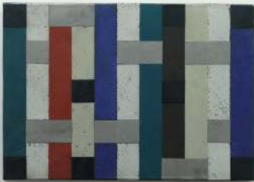
2003 - murales. Doble cocción