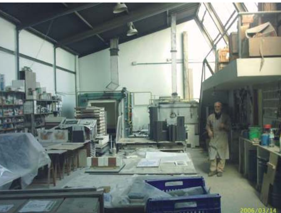
Entrada de su taller y vistas

Me lanzo a trabajar el barro no por un conocimiento del proceso cerámico, sino por una circunstancia del azar. Finalizados mis estudios de Bellas Artes y sin trabajo en ese momento, me matriculo en la escuela de cerámica de Manises para aprender y ampliar conocimientos; una vez allí me enganché en el trabajo cerámico, aunque lo que más me estimuló por entonces, fue conocer a Alfons Blat, ya que él no era un profesor corriente, es decir, no era un profesor de dibujo enseñando cerámica -cosa que pasaba y pasa habitualmente-, sino que él era ceramista, con un taller propio, donde investigaba, realizaba sus propias piezas, conocía los procesos. Y sobretodo lo que más me impresionó era su dedicación, su entrega en cuerpo y alma al desarrollo de una idea. Realmente hasta esa fecha nunca me