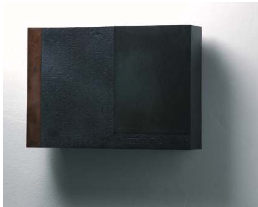
Gres, 16x64x44 - 2004

Nos despedimos, de nuestro querido maestro, de su precioso taller, de sus campos de chufas y de su mar hasta la próxima, que esperamos sea este Agosto en La Rambla donde podremos seguir disfrutando, en la oportuna sucursal, de la inconcebible horchata de Alboraya.