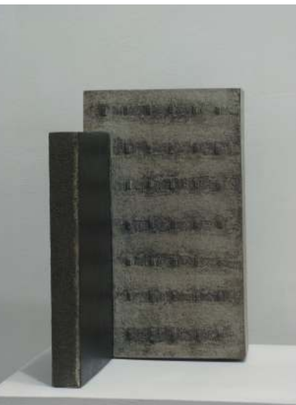
42,5x10x20,5 - 2004 - gres. 18x37,5x18,5 - 2003. - gres. pieza para pared. 39x38,5x31 - 2004 - gres. 27x22,7x17,8 - 2004 - gres.