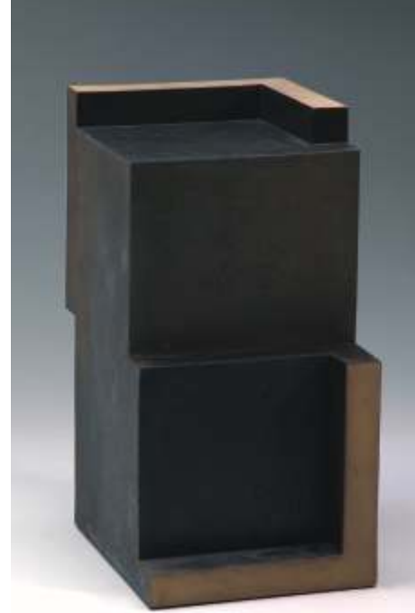
Gres, 40x23x23 - 2005