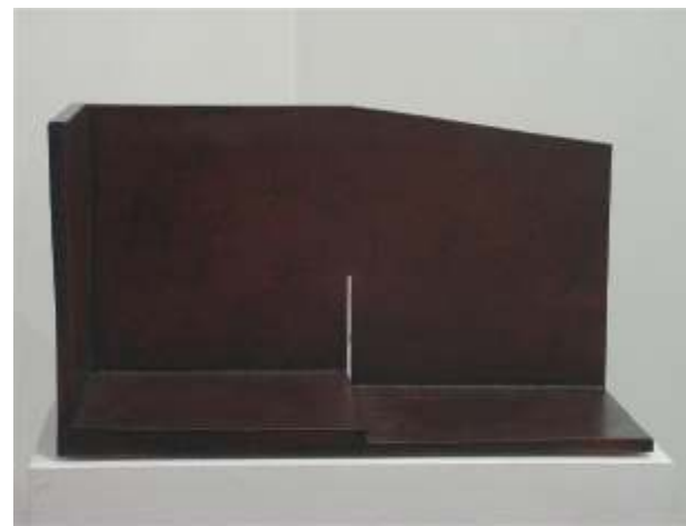
48x27x23 -2005 doble cocción

hacia lo elemental. Cuando repaso mi trabajo de la Escuela de Bellas Artes, me doy cuenta de que lo más importante para mí era el dibujo, la forma. En realidad vas orientándote a través de la historia del arte, quiénes son los artistas o las corrientes que más te interesan. A partir de ahí, percibes una línea a seguir, te vas involucrando en los aspectos que más te interesan, y de ahí van surgiendo esas estruc-