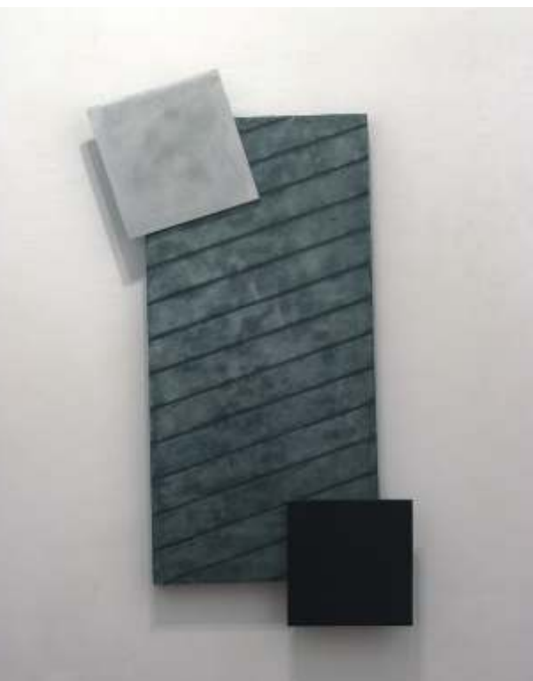
115x7x70 - 2005 - gres y aluminio. Pieza pared.

También los viajes influyen mucho. Hay algunos en los que disfruto muchísimo de lo que estoy viendo, pero que no me sirven para expresarme. Por ejemplo, cuando fui a Venezuela y realicé un viaje a la selva, aquella espesura, aquel caos era impresionante. Pero la selva es imposible de ordenar, de racionalizar, es un disfrute para los sentidos.