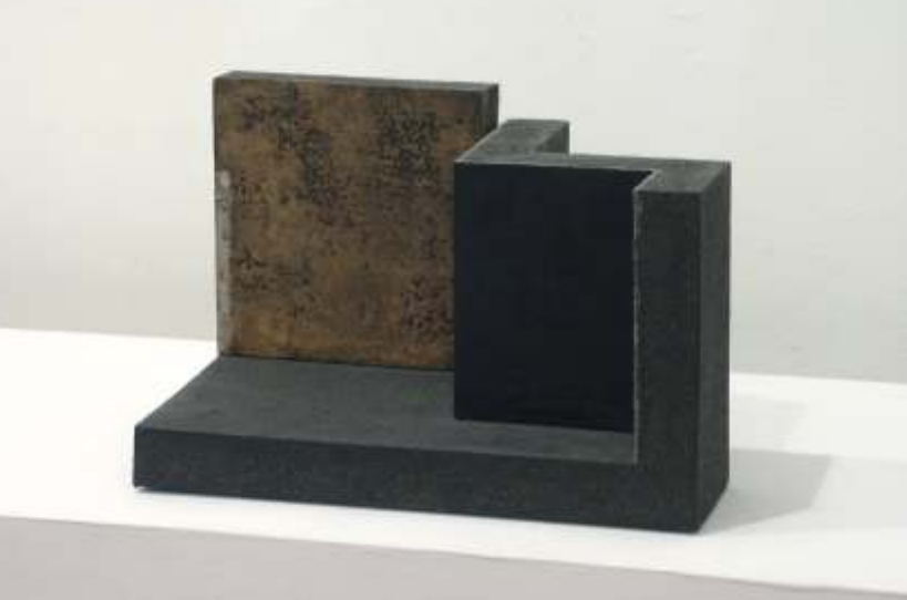
33,5x21,5x19,5 - 2004- gres

sorado suficientemente cualificado. En la inmensa mayoría se trata de escultores impartiendo una asignatura teórica eso sí, aleccionando a los alumnos con buenas ideas, pero sin un suficiente conocimiento en técnica cerámica, es decir, cómo hay que secar, cómo hay que cocer, cómo hay que cargar un horno... cuestiones básicas e imprescindibles en cerámica.