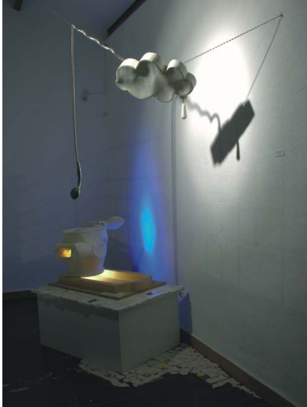
Alfonso Reverón: Haga usted su propio W.C. Cerámica, madera y ducha.

Los materiales a utilizar ya no eran los que habían por casa sino los que encontraba por la